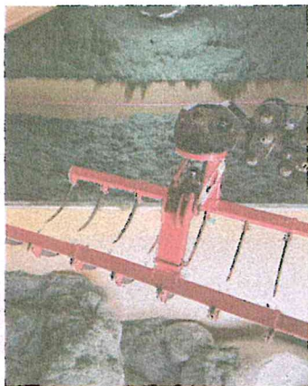
Eine gut gefüllte Heubergehalle braucht einiges an Vorarbeit.

Die Arbeit geht aber beim Heu leichter von der Hand, da es zum ei-